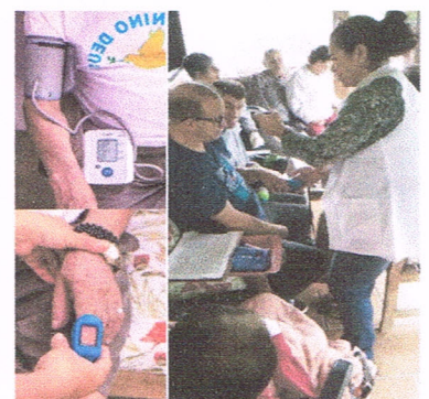
Cuidados com os moradores