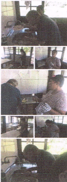
Atividades de Vida Diárias