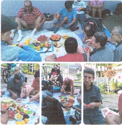
Atividades Equipe Multidisciplinar